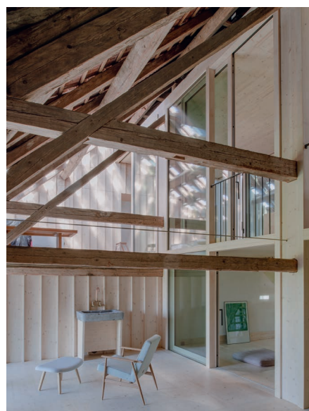
Transformation en habitation d'une ferme protégée à Cottens (FR).

Die Maisons Duc in Saint-Maurice (VS) vereinen ein Kunstzentrum und Wohnungen.