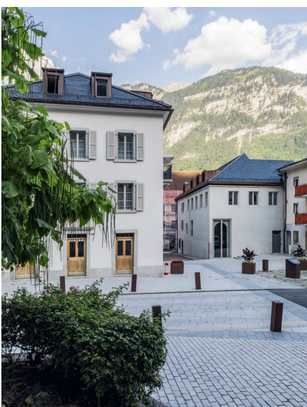
Les Maisons Duc à Saint-Maurice (VS) réunissent un centre artistique et des logements.

Die 2003 in der Westschweiz lancierte DRA zeichnet Bauten der letzten Jahre aus, die zu einer qualitativ hochwertigen Baukultur beitragen. Der Schweizer Heimatschutz und seine Waadtländer Sektion sind Partner der «DRA5». Ab September werden die 17 nominierten Projekte im Rahmen einer Wanderausstellung in der Westschweiz zu sehen sein. Daneben ist zudem eine Publikation geplant.