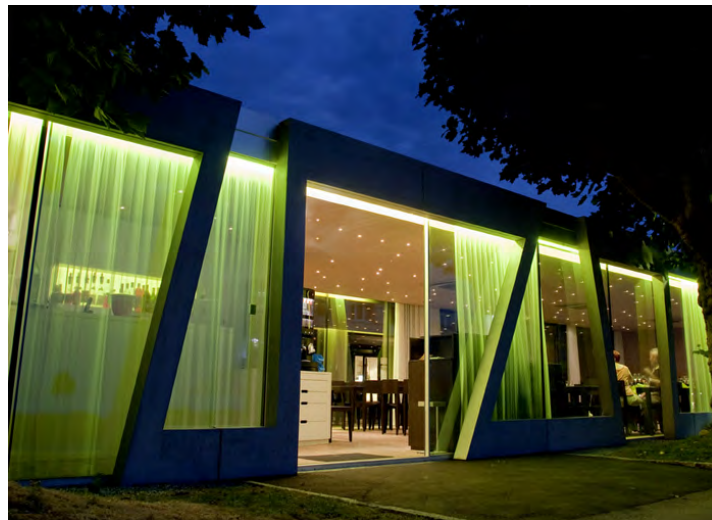
Vue de l'entrée côté Lac