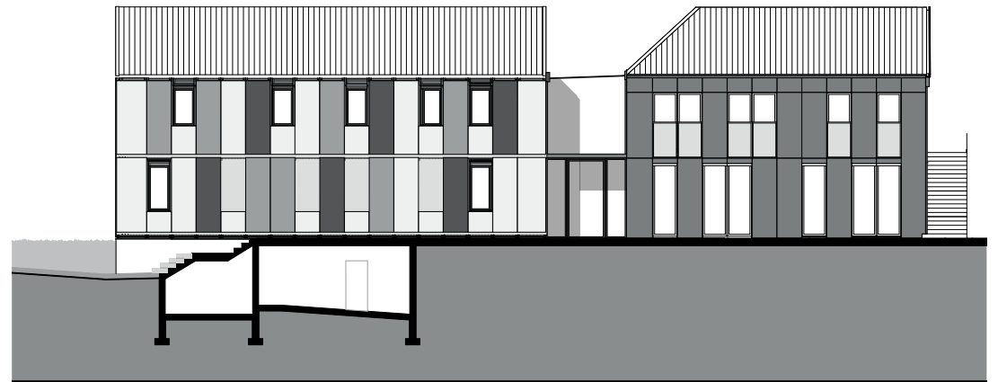
Façade Sud - Est 1:250