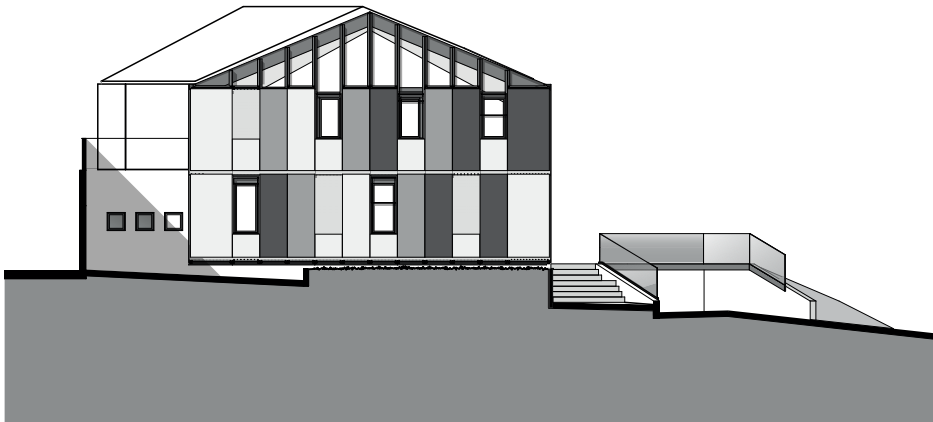
Façade Ouest 1:250